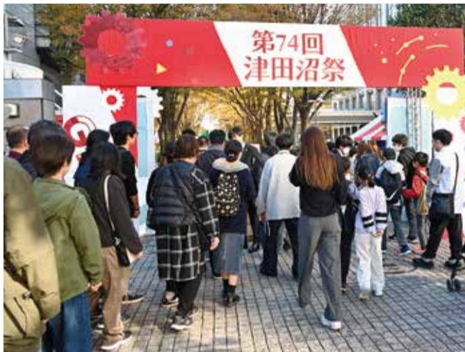
晴れの2日目は地域の人たちが続々と訪れた