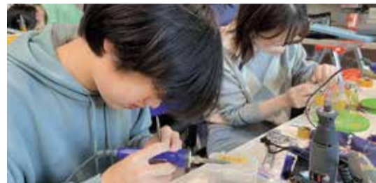
▶ 力を合わせて製作