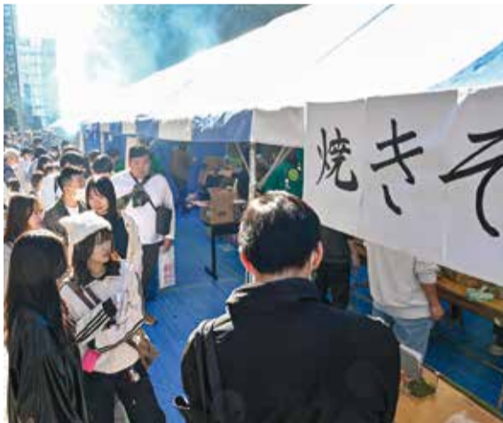
メニュー豊富、人気の模擬店