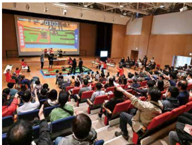
初日、イベントでにぎわう大教室