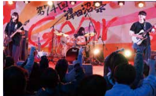
初日のステージイベント