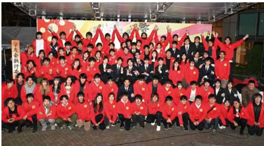
やりとげた！ 実行委員たちが記念撮影