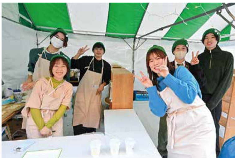
力を合わせ、みんなで楽しんだ大学祭