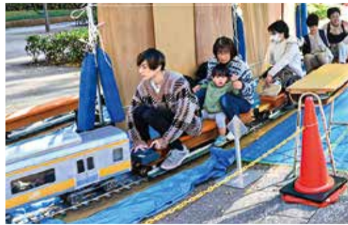
ミニ電車は年齢を問わず大人気