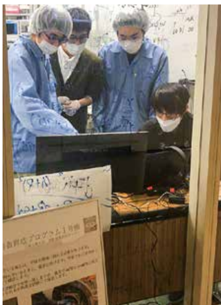
真剣に作業に取り組むメンバーたち

「世界文化に技術で貢献する」—建学の精神に基づき、本学は2021年4月に育成プログラムを開始した。惑星探査研究センター(PERC)の指導を受けながら、学生たちが1辺10センチの立方体の超小型衛星キューブサットII重量約1キログラムを基本設計、製造し、ミッションを考案している。今回2号機のミッションは、撮影した画像を地上で復元することを最小限の成功と設定しているが、プログラムの目的とし