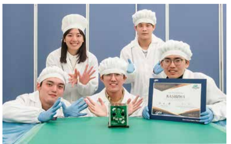
JAXAに2号機を納入し記念撮影

「同じ志を持ち、ともに困難を乗り越えながら1つのものを作り上げてきた。ものづくりでは、自分の作ったものに責任が伴うこと、その責任を果たすための緊張感、普段の学業だけでは経験できない」と意義を語っている。キャラクターも作成 学生たちは超小型衛星のミッションを「擬人化したキャラクター」も作成した。描いたのはカメラミッションを担当し