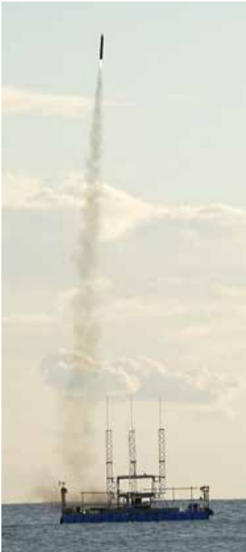
▶ 御宿の海を駆け上がる手作りロケット

隅郡御宿町の海上で打ち上げに成功した。なぜ参加？の質問に「他校の人たちと交流できる」「設計・製作技術、リーダーシップスキル、最後まであきらめない力をつけたい」といった「普段の学校生活では味わえない体験を講座で得られる」といった意識的だった。