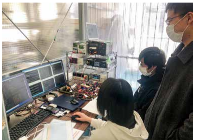
超小型衛星の設計・検証作業