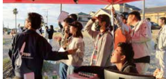
▶ 打ち上げを見守る

が完成し、子どもたちが遊んでいる姿を見られてうれしい。親子一緒に楽しむ姿は個人的な学びにもなった。体験や経験は子どもにとってとても大切。作ることが大好きなので、これからも好奇心をくすぐるものを作っていきたい」と話した。