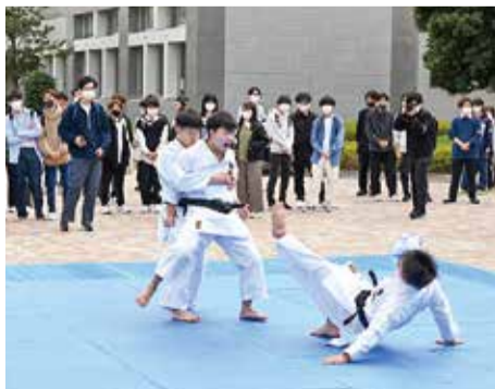
相手を見せる空手部