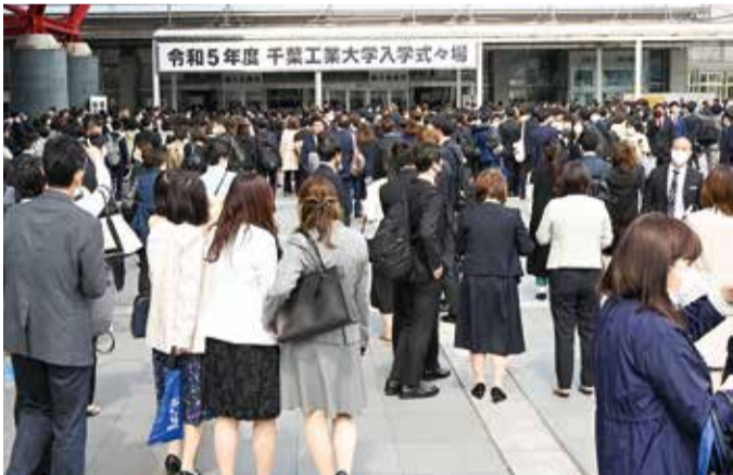
幕張メッセ・イベントホールの式場前で