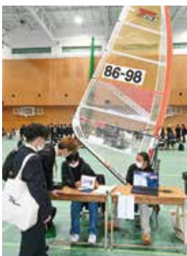
セイルで目を引くウィンドサーフィン部

転、各種学生行事の再開が期待されている。 3会の新入生歓迎祭運営本部では「課外活動を通じて、学科の枠にとらわれず新たな仲間に出会い、刺激し合い喜び合って、希望に満ちた学生生活を過ごしてほしい」と話している。