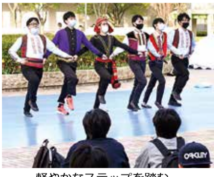
軽やかなステップを踏むフォークダンス部