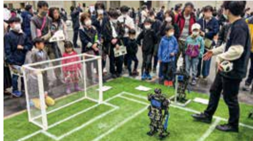
OB。CIT Brainsは、ジュニアたちや、科学に興味を抱く人々と交流を図ろうと名古屋市の開催事務局（経済局イノベーション推進部次世代産業振興課内）に掛け合い実現した。

ロボカップ国内・世界リーグを志すジュニアたちの「ロボカップジュニア・ジャパンオープン2023名古屋」が3月24〜26日、名古屋国際展示場・ポルトメッセなどで第3展示館で開かれ、千葉工大未来ロボティクス学科有志の「CIT Brains」チームの6人が、昨年の世界大会優勝ロボットの「SUSTAINABLE」を持ち込んで招待デモンストレーションを行った。