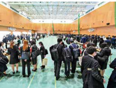
にぎわうサークル博覧会