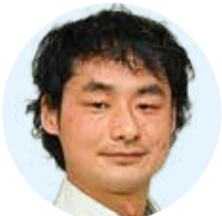
町田上席研究員は写真撮影は密集域発見の経緯、

和田教授らは「ロケット方式」で高頻度・低価格の打ち上げを実現すべく研究開発に取り組んでおり、その第一歩となる地上燃焼試験を成功させた。電動ターボポンプを用いたロケットエンジンの燃焼試験も国内初で、開発の敷居を下げる電動ターボポンプ技術は日本の宇宙産業の発展に寄与するものと注目される。