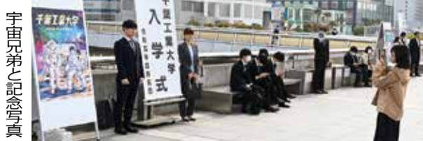
宇宙兄弟と記念写真