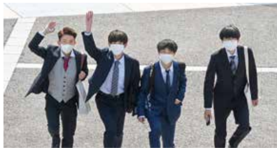
仲間と学生生活を楽しむぞ

世の中になくものを作る 知能メディア工学科 VRに興味があり、検索したら「千葉工大」と……。新しいことに挑戦し、世の中になくものを作り出したい。ガイダンスでの研究室クイズなど、楽しい雰囲気学科です。基礎から学び、専門分野に生かせるよう頑張ります。