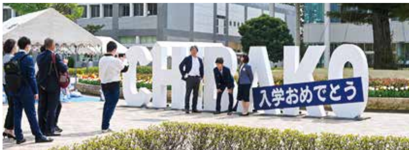
快晴に恵まれ、順番待ちで記念撮影