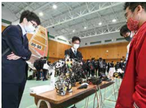
自作ロボットを語る総合工学研究会

「ぜひ課外活動にも参加し、学生生活を豊かに！」——新入生に向けて、学生3会（学生会・体育会・文化会）の学生3会は4月5〜8日、新習志野キャンパスの体育館、食堂前広場、1号館（講演会場）でサークル博覧会を開催。デモンストレーションなどで新入生のほか新2年生にも部活・サークルへの参加を呼びかけた。 本学公認のクラブ・サークルは、体育会、文化会の部活動に同好会、愛好会を加えて約70団体。新型コロナウイルス感染症の5類への変更を控え、自粛ムードから一