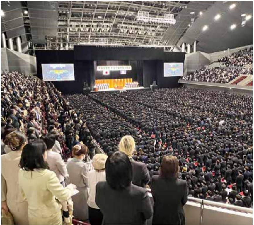
立ち見する保護者らで会場を埋め尽くした入学式

や技術が、将来の職業と直結するからです。それだけに自らの将来像をいかに思い描きながら研究課題に取り組んでいくか、その心構えがとても大切になります。