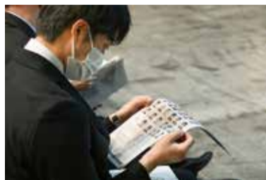
さっそく先生方を確認